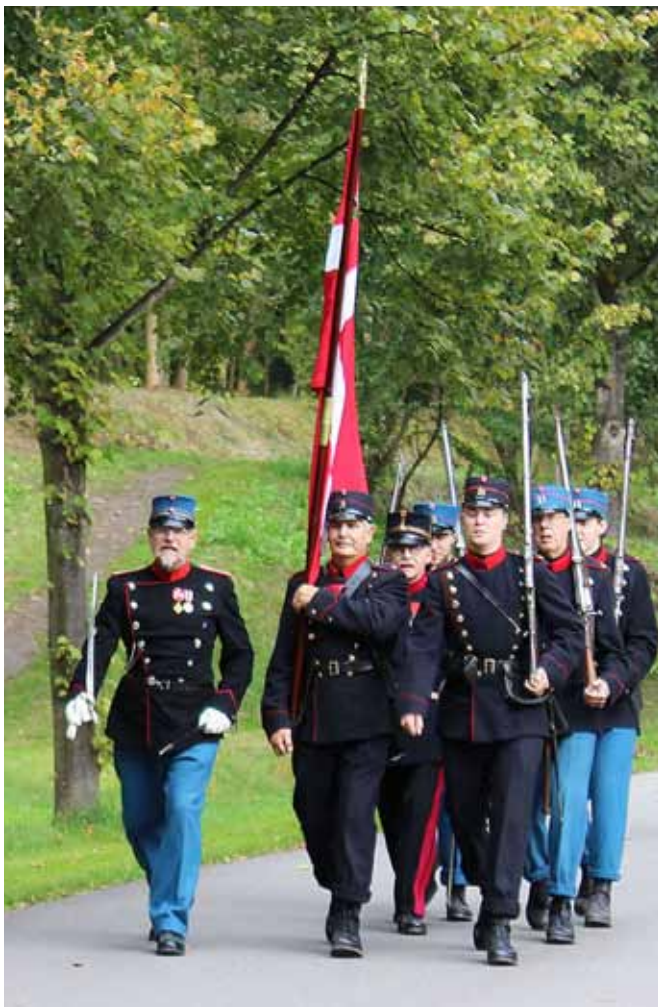
Fæstningsartillerister og fodfolk 1914-18